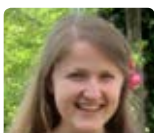
P. Rediger Burkina Faso juil. - août 15