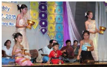
Cérémonie d'ouverture de l'Assemblée Générale mondiale

Merci de vous joindre à nous dans la prière pour un engagement renouvelé à atteindre les «perdus». La prière est la fondation de notre vie et de notre ministère. «Par la prière» nous louons Dieu, cherchons sa direction, demandons des ressources et faisons appel à l'Esprit Saint de manifester sa puissance dans nos ministères.