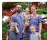
Deneufchâtel Bénin long-terme