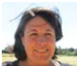
D. Diebold Bolivie août 14 - août 16