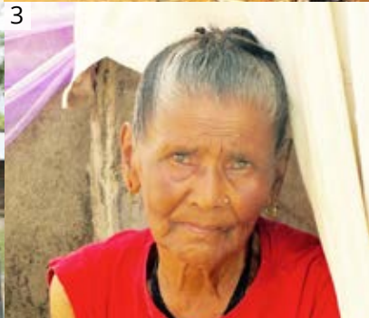
1/maison détruite dans les hauteurs himalayennes, 2/une équipe d'UMN mobilisée, 3/une népalaise sous le choc et sans abri, 4/un immeuble de Katmandou détruit, 5/un hôpital bondé suite à la tragédie.