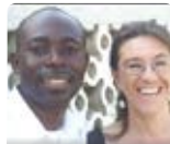
Boungou En transition long-terme