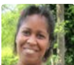
C. Berthelot Mayotte juillet 15