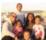
Mbodwam Congo long-terme 16