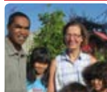
Ratahinarivelo Madagascar long-terme