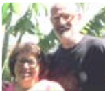
Oléart Madagascar avril - juin 15