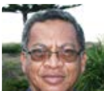
D. Ratovo Madagascar long-terme