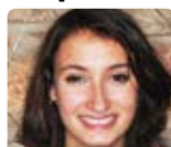
A. Petit Burkina Faso juil. - août 15