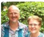
Soudrain Bénin long-terme