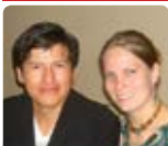
Ortiz Bolivie long-terme