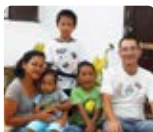
Lê Madagascar long-terme